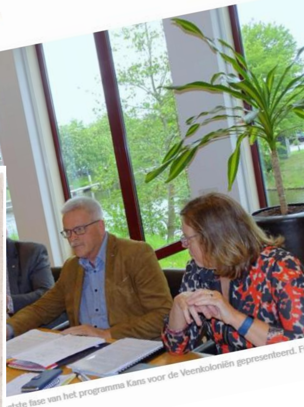
Laatste fase van het programma Kans voor de Veenkoloniën gepresenteerd.

„We moeten die cultuur ombuigen”, zegt Blokhuis. „We moeten investeren in een gezonde leefstijl, jongeren motiveren gezondere keuzes te maken. Zodat ze vette happen