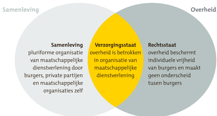
Afbeelding 1 Verzorgingsstaat op het snijvlak van rechtsstaat en samenleving

het hebben van gelijke kansen. De verzorgingsstatelijke taken van de overheid zijn onderworpen aan de eisen die de rechtsstaat in algemene zin aan het handelen van de overheid stelt. Afbeelding 1 geeft dit schematisch weer.