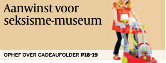
Aanwinst voor seksisme-museum