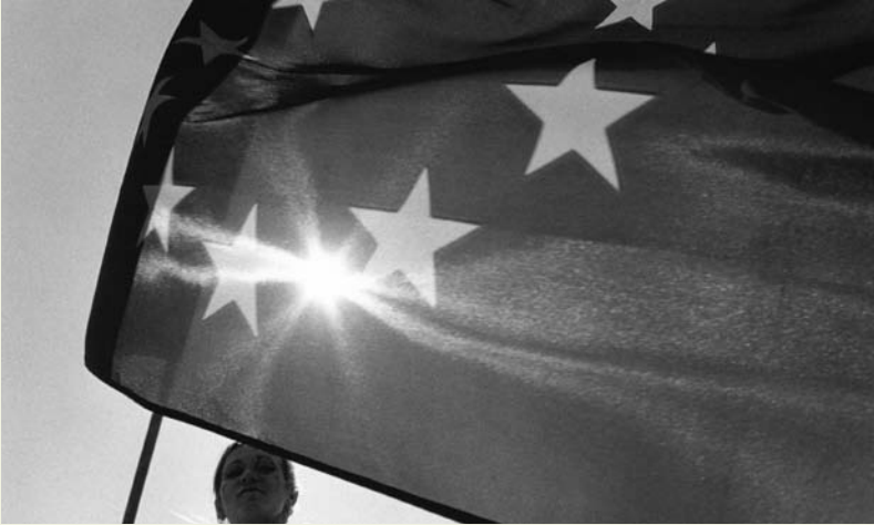
Gliwice, Polen 09-05-2002: Poolse scholier zwaait met een Europese vlag

De RMO pleit er in dit advies voor dat meer aandacht wordt geschonken aan de symbolische en meer impliciete aspecten van betrokkenheid.