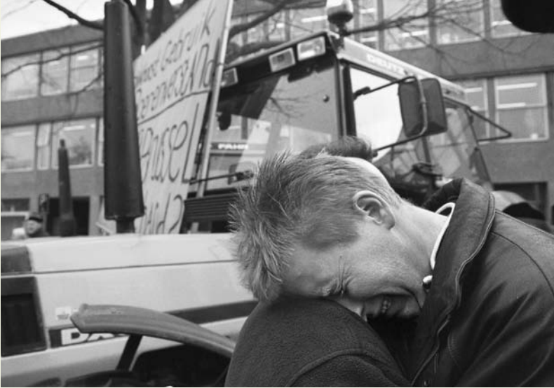
Epe, Nederland 28-03-2001: Hoog oplopende emoties bij een demonstratie van boeren in het kader van de uitbraak van mond en klauwzeer.

nen hun beroep niet of nauwelijks uitoefenen zonder een gedegen Europese oriëntatie. Dit leert dat de betrokkenheid van burgers tot stand komt door aan te sluiten bij concrete kwesties en initiatieven van onderaf. Daarnaast kan de overheid ook aansluiten bij initiatieven van het bedrijfsleven, waar dat sterk europeaniseert.