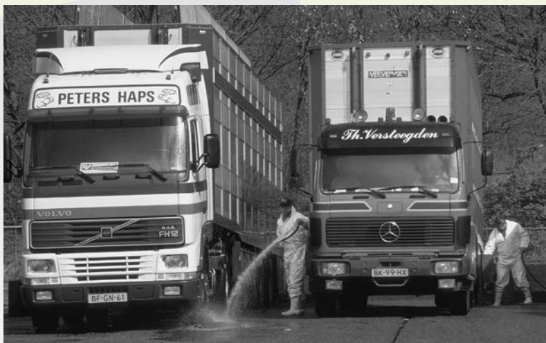
Vrachtwagens worden schoongemaakt om verspreiding van de varkenspest tegen te gaan.

De RMO wil in dit advies aangeven op welke wijze de achteruitgang in de betrokkenheid van Nederlandse burgers bij de EU kan worden tegengegaan en een actieve betrokkenheid kan worden bevorderd.